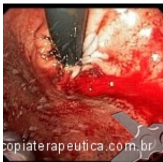
Vaso não associado á ulceração com sangramento ativo no cárdia