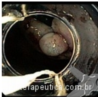
Ligadura elastica em retrovisao