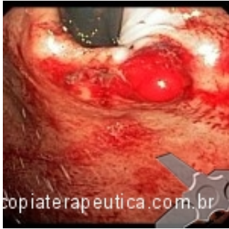
Vaso com sangramento ativo no cárdia