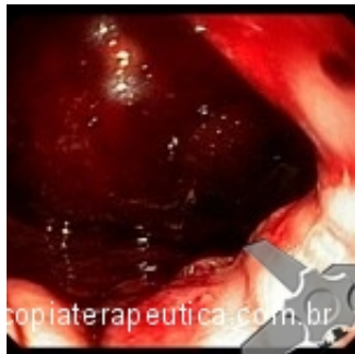
Coágulos no estômago