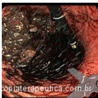
Resíduos alimentares e restos hemáticos após lavagem gástrica com soro fisiológico