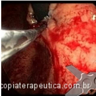
Injeção de soro e adrenalina