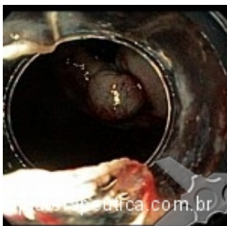
Ligadura elástica em retrovisão